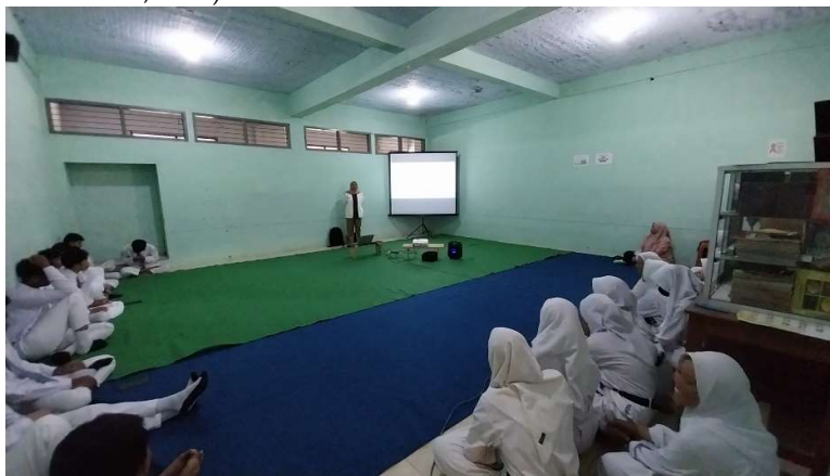
Gambar 3. Dokumentasi Kegiatan

Banyak cara untuk mencegah penyimpangan seksual diantaranya yaitu jauhi lingkungan yang mengajak melakukan penyimpangan seksual, bersikap tegas, katakan tidak pada perbuatan maksiat, pengendalian diri, jangan minum alkohol dan obat terlarang, membentengi diri dengan pengetahuan agama (Yora Chantika et al., 2023).