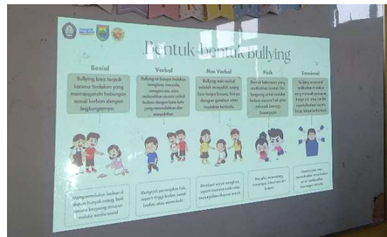
Gambar 1. Penampilan Materi Menggunakan Infocus

Sebagai alternatif dalam menyampaikan materi, pemaparan ini menggunakan coaching yang digunakan bersama dengan media poster digital yang menampilkan tema-tema anti-bullying untuk melaksanakan intervensi. Infocus digunakan untuk menampilkan poster digital secara visual di dalam kelas sehingga semua siswa dapat melihat dan memahami pesan-pesan anti-bullying dengan cara yang menarik dan jelas. Karena pesan-pesan anti-bullying secara visual lebih mudah diterima dan diingat oleh siswa, penggunaan media visual, seperti poster digital, terbukti meningkatkan perhatian dan pemahaman siswa terhadap materi yang disampaikan. Selain itu, pelatihan ini juga bersifat interaktif, melibatkan diskusi, tanya jawab, dan presentasi materi, untuk membantu siswa menginternalisasi nilai-nilai anti-bullying dengan lebih baik dan terlibat secara aktif dalam proses pembelajaran. Kami melakukan pengamatan langsung terhadap perilaku dan interaksi siswa selama proses pembinaan dan penayangan poster digital. Pengamatan ini, bersama dengan hasil pre-test dan post-test , kemudian dianalisis untuk menentukan seberapa efektif intervensi tersebut. Strategi ini konsisten dengan temuan yang menyatakan bahwa, ketika digunakan bersama dengan teknik pembelajaran aktif, media visual dapat memperkuat perubahan positif pada sikap dan perilaku siswa.