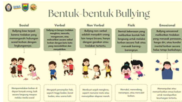
Gambar 4. Poster Digital Tentang Bullying Oleh Universitas Diponegoro

anti perundungan. Media poster digital yang disajikan melalui perangkat seperti Infocus memungkinkan untuk menyajikan informasi secara visual dan interaktif, sehingga lebih mudah dipahami dan menarik perhatian siswa (Safira et al., 2023).