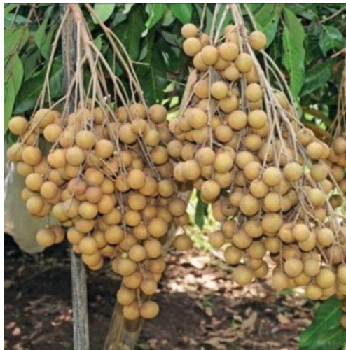
Gambar 2. Kelengkeng New Kristal

Pengembangan kelengkeng New Kristal ini semakin kuat karena mendapatkan perhatian dan dukungan dari pemerintah kalurahan melalui BUMKal. Pengelolaan lahan secara terencana dilakukan untuk memperluas skala produksi kelengkeng. Dukungan kelembagaan ini menunjukkan adanya langkah strategis dalam pengembangan potensi agribisnis desa. Sinergi antara masyarakat, perangkat desa, dan BUMKal mencerminkan model pembangunan berbasis partisipasi. Hal ini memperkuat fondasi pembangunan ekonomi lokal berbasis komoditas unggulan desa.