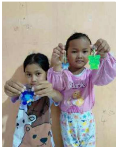
Gambar 7. Pemanfaatan Sampah Plastik Menjadi Gantungan Kunci

Program kreatif bertema lingkungan juga dilaksanakan melalui kegiatan pembuatan gantungan kunci dari tutup botol plastik bertema “Sampahku Karyaku”. Kegiatan ini melibatkan anak-anak sebagai peserta utama untuk menumbuhkan kreativitas dan kepedulian terhadap pengelolaan sampah. Aktivitas dimulai dari pengumpulan sampah plastik, pemilahan, hingga pembentukan karya. Anak-anak terlihat antusias dan merasa bangga menghasilkan benda yang dapat mereka kenakan atau berikan sebagai hadiah. Program ini diharapkan membangun kesadaran sejak dini tentang pentingnya daur ulang dan tanggung jawab terhadap lingkungan.