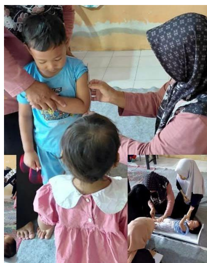
Gambar 8. Proses Kegiatan Pos Pembinaan Terpadu

Selain itu, kelompok KKN aktif berpartisipasi dalam kegiatan Pos Pembinaan Terpadu yang rutin dilaksanakan di desa. Dalam kegiatan ini mahasiswa membantu proses pencatatan data, pengukuran berat badan, tinggi badan, tekanan darah, hingga administrasi kesehatan ringan. Keterlibatan ini tidak hanya mendukung peran kader kesehatan, tetapi juga memperkuat kedekatan antara mahasiswa dan warga. Dengan hadirnya mahasiswa, proses pelayanan menjadi lebih cepat dan terkoordinasi. Hal ini menunjukkan kontribusi nyata mahasiswa dalam mendukung kesehatan masyarakat desa.