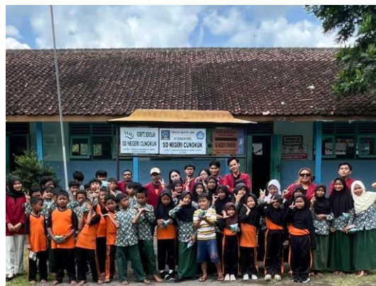
Gambar 6. Dokumentasi Bersama Siswa SDN Cungkuk