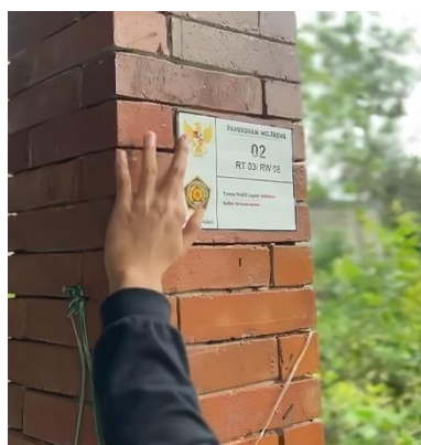
Gambar 4. Pemasangan Nomor Rumah

Program kedua ialah sosialisasi literasi digital dan pencegahan cyberbullying yang ditujukan kepada siswa kelas 1 hingga 6 di SD Negeri Cungkuk. Materi disampaikan dengan metode interaktif sehingga siswa tidak hanya mendengar, tetapi juga diajak berpikir dan merespon secara langsung. Pendekatan bahasa sederhana digunakan agar pesan mudah dipahami oleh anak usia sekolah dasar. Dalam kegiatan ini juga diberikan contoh nyata bentuk cyberbullying seperti perundungan di media sosial atau grup pesan instan. Dengan pemahaman ini, siswa diharapkan lebih berhati-hati dalam berinteraksi di dunia digital dan memiliki kesadaran etika dalam berkomunikasi secara daring.