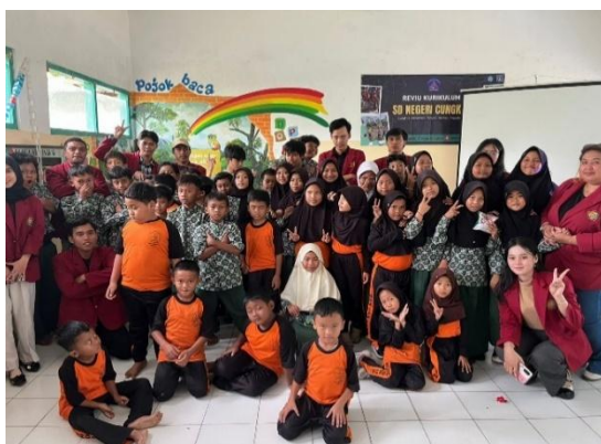
Gambar 5. Dokumentasi Sebelum Sosialisasi Teknologi dan Cyberbullying

Program kedua ialah sosialisasi literasi digital dan pencegahan cyberbullying yang ditujukan kepada siswa kelas 1 hingga 6 di SD Negeri Cungkuk. Materi disampaikan dengan metode interaktif sehingga siswa tidak hanya mendengar, tetapi juga diajak berpikir dan merespon secara langsung. Pendekatan bahasa sederhana digunakan agar pesan mudah dipahami oleh anak usia sekolah dasar. Dalam kegiatan ini juga diberikan contoh nyata bentuk cyberbullying seperti perundungan di media sosial atau grup pesan instan. Dengan pemahaman ini, siswa diharapkan lebih berhati-hati dalam berinteraksi di dunia digital dan memiliki kesadaran etika dalam berkomunikasi secara daring.