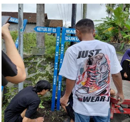
Gambar 3. Pemasangan Plang Jalan

Program kerja pertama yang berhasil diwujudkan adalah pengadaan plang dan penomoran rumah untuk warga di RT 01 hingga RT 04 yang jumlahnya mencapai kurang lebih 150 titik. Penandaan ini meningkatkan ketertiban administrasi alamat, sehingga mempermudah pengiriman surat, paket, dan akses layanan publik. Identifikasi rumah yang jelas juga mendukung aktivitas sosial seperti kunjungan warga, kegiatan keagamaan, atau pendataan kependudukan. Warga menyambut baik program ini karena memberikan manfaat praktis dalam keseharian. Dengan terpenuhinya fasilitas penomoran ini, tata ruang sosial desa menjadi lebih tertata dan informatif bagi penduduk maupun pendatang.