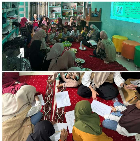
Gambar 2. Pelaksanaan Psikoedukasi