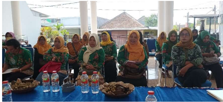
Gambar 2. Sosialisasi Ibu-ibu kader kesehatan