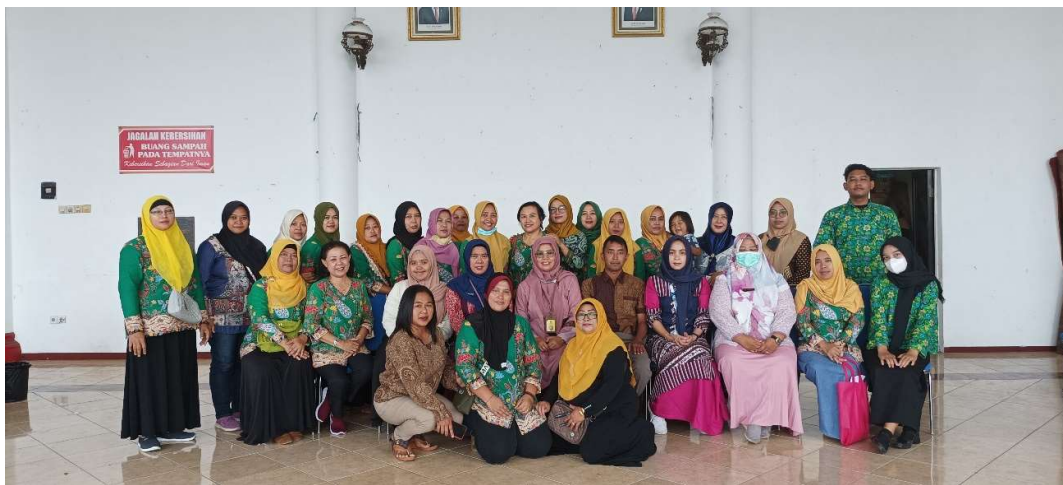
Gambar 3. Kegiatan bersama setelah sosialisasi dan pelatihan PHBS

Observasi Di desa Pandanlandung saat dilokasi, banyaknya warga yang non kader kurang berperilaku hidup bersih dan sehat. Sebab di Desa Pandanlandung adanya desa dekat area industry. Ini menyebabkan bahwa warga kurang perhatian oleh perilaku hidup sehat, karena himpitan ekonomi serta kurangnya sumber daya manusia yang kurang mengerti tentang kesehatan.