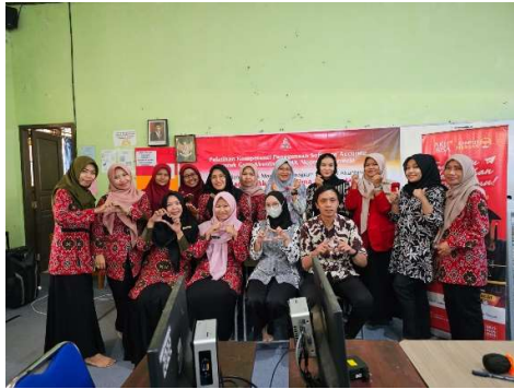
Gambar 3. Tim PKM berfoto bersama Peserta