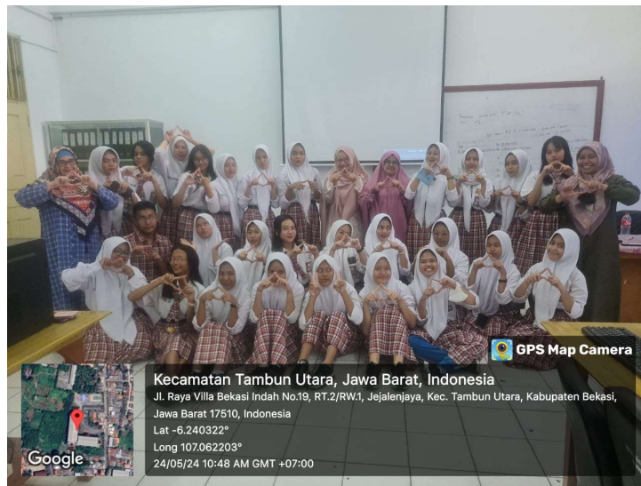
Gambar 4. Foto Bersama Pemateri dan Siswa