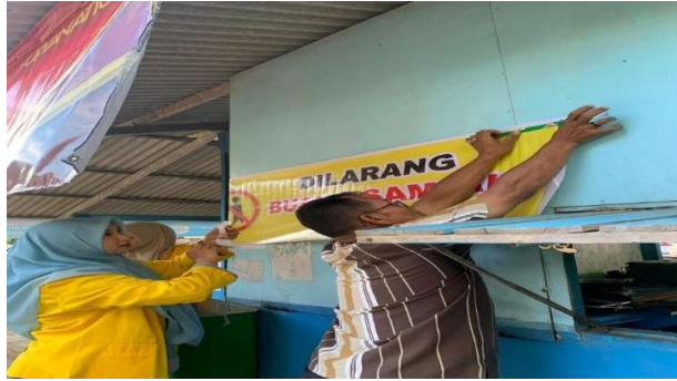
Gambar 4. Pemasangan Spanduk