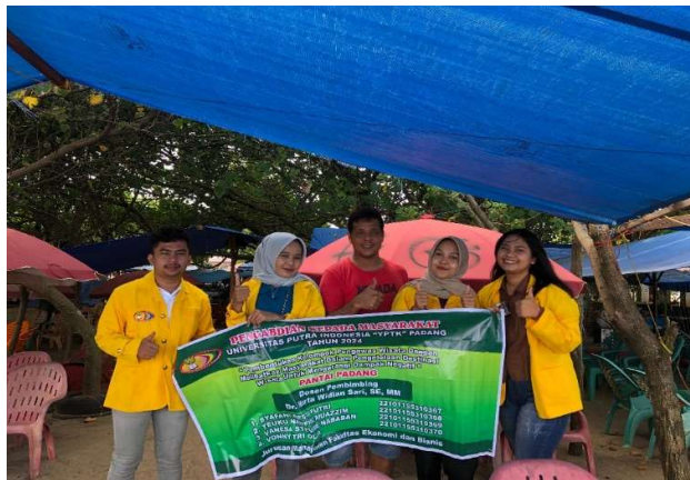
Gambar 2. Dokumentasi dengan Pedagang Kaki Lima

Tahap pertama dari kegiatan ini adalah tim PKM melakukan diskusi terkait penentuan objek atau tempat pelaksanaan kegiatan, tim PKM menyimpulkan akan memilih taplau Padang sebagai objek yang terletak di Jalan Samudera, Muaro Lasak, Padang Barat, Kota Padang, Sumatra Barat 25114. Melalui diskusi dan koordinasi terhadap pengelola kami memilih jadwal perdana ke lokasi yaitu tanggal 12 Juli 2024