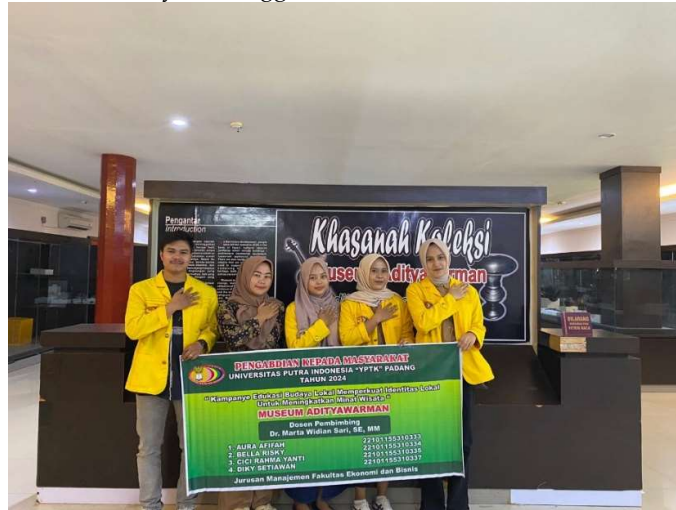
Gambar 2. Dokumentasi dengan Pemandu Museum

Barat., Kota Padang, Sumatra Barat 25114. Melalui diskusi dan koordinasi terhadap pengelola kami memilih jadwal perdana ke lokasi yaitu tanggal 11 Juli 2024.