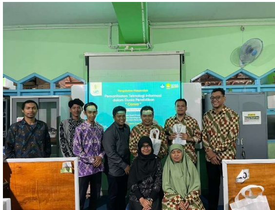
Gambar 2. Pelaksanaan Pembuatan Media Pembelajaran

Canva yang menyesuaikan materi yang akan diajarkan dikelas oleh guru yang bersangkutan. Selama proses pembuatan media pembelajaran tim pengabdian akan mengawasi dan memberikan bantuan apabila ada peserta yang merasakan kesulitan dalam penggunaan aplikasi Canva. Lalu terakhir Tim melakukan evaluasi kegiatan pelatihan pembuatan media pembelajaran menggunakan Canva dan evaluasi ini dilakukan pada 10 menit sebelum acara selesai. Pada tahap ini setiap peserta mengirimkan hasil karya media pembelajaran yang telah dibuat ke dalam google classroom yang sudah dibuat oleh Tim Kegiatan pengabdian.