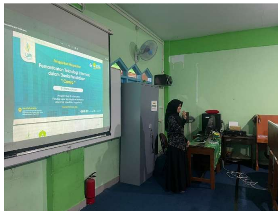
Gambar 1. Perencanaan Kegiatan Pelatihan

Lalu lanjut dengan pembuatan media pembelajaran inovatif menggunakan aplikasi Canva. Pada kegiatan ini pemateri memberikan materi pengenalan aplikasi canva yang akan digunakan selama pelatihan mulai dari pengenalan login, fitur-fitur canva, edit teks, memasukan gambar, mengelompokkan gambar dan teks, mengubah bentuk huruf, dan editing video pembelajaran.