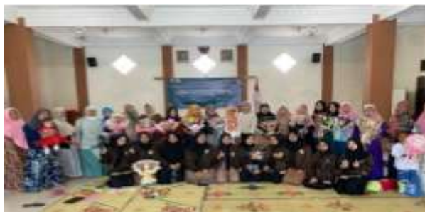
Gambar 3. Simulasi melalui pengembangan kewirausahaan

Pada tahap ini proses yang terjadi meliputi sebagai berikut: