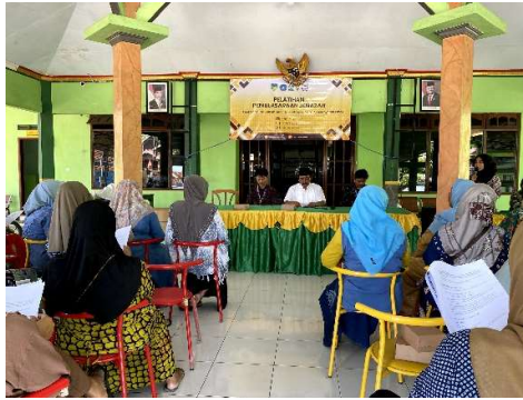
Gambar 3. Sambutan oleh Kepala Desa

Dalam pelatihan tersebut, materi pertama disampaikan oleh salah satu mahasiswa KKN Kelompok 73 IAIN Kediri. Materi yang disampaikan mengenai tahapan dalam proses pemulasaraan jenazah sesuai syariat Islam, yang meliputi memandikan jenazah, mengkafani jenazah dan mensholatkan jenazah serta proses penguburan jenazah. Mahasiswa tersebut memberi penjelasan yang rinci dalam setiap tahap, yang dimulai dari persiapan alat dan bahan yang dibutuhkan sampai dengan teknik-teknik yang harus diterapkan dalam proses pemulasaraan.