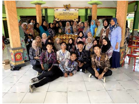
Gambar 6. Sesi Foto Bersama dengan Peserta