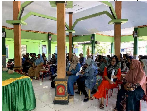
Gambar 2. Peserta Pelatihan Pemulasaraan Jenazah

Pelatihan mengenai tata cara pemulasaraan jenazah merupakan hal yang sangat penting untuk diterapkan di lingkungan masyarakat, khususnya di daerah pedesaan dikarenakan hanya ada beberapa orang yang memahami dan masih banyak masyarakat yang belum memahami tentang pemulasaraan jenazah, oleh karena itu pelatihan ini dirancang untuk melibatkan lima orang dari setiap RW. Adapun lokasi pengabdian ini terletak di Desa Purwodadi, Kecamatan Purwoasri, Kabupaten Kediri, tepatnya di balai Desa Purwodadi. Lokasi ini dipilih karena merupakan titik pusat kegiatan masyarakat, sehingga memudahkan peserta untuk hadir dan mengikuti pelatihan.