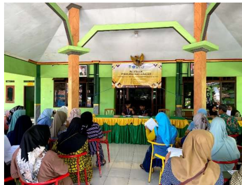
Gambar 4. Pemateri dari Mahasiswa KKN IAIN Kediri

Dalam pelatihan tersebut, materi pertama disampaikan oleh salah satu mahasiswa KKN Kelompok 73 IAIN Kediri. Materi yang disampaikan mengenai tahapan dalam proses pemulasaraan jenazah sesuai syariat Islam, yang meliputi memandikan jenazah, mengkafani jenazah dan mensholatkan jenazah serta proses penguburan jenazah. Mahasiswa tersebut memberi penjelasan yang rinci dalam setiap tahap, yang dimulai dari persiapan alat dan bahan yang dibutuhkan sampai dengan teknik-teknik yang harus diterapkan dalam proses pemulasaraan.