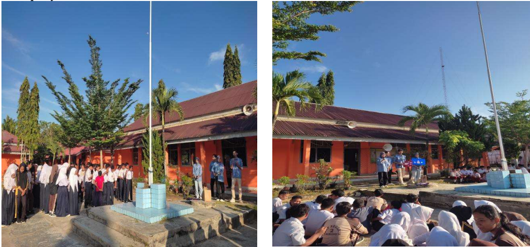
Gambar 2. Dokumentasi kegiatan

terhadap media sosial, seperti menghindari akun-akun palsu, tautan berbahaya, atau penyebaran berita hoaks.