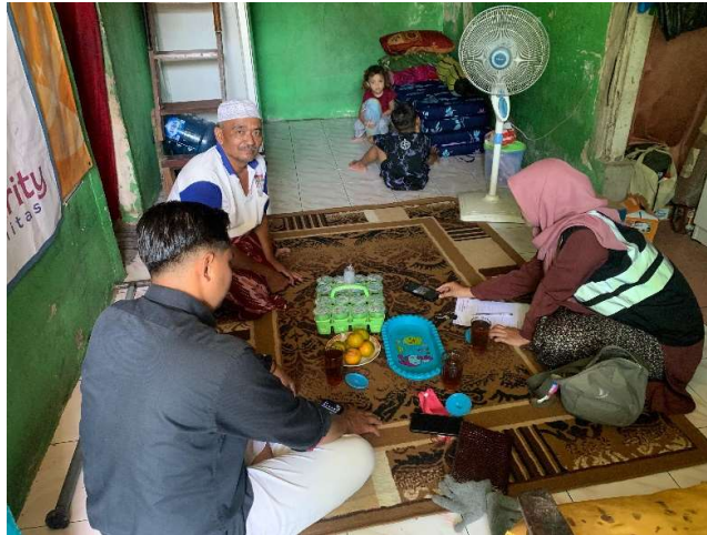
Gambar 1. Proses FGD Dengan Mustahik

sering digunakan dalam penelitian sosial, pemasaran, pengembangan produk, dan evaluasi program untuk mendapatkan informasi yang lebih kaya (Yasril dkk, 2018). Selain itu, tujuan dari FGD ini yaitu, untuk mengetahui beberapa permasalahan yang lebih dalam mengenai keluhan atau masalah yang dialami oleh mustahik .