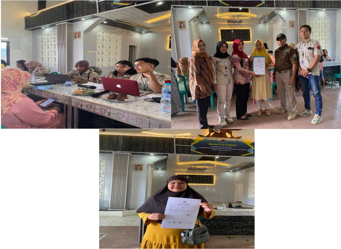
Gambar 3. Dokumentasi Kegiatan

Setelah dilaksanakan pendampingan pembuatan NIB kepada UMKM dan dokumen NIB telah terbit. Selanjutnya dokumen NIB yang telah terbit diserahkan kepada pelaku usaha untuk membantu UMKM agar memiliki bukti fisik terkait legalitas usahanya. Hasil dari kegiatan pendampingan pembuatan NIB yaitu diharapkan dapat mengurus perizinan lain yang dibutuhkan UMKM untuk mengembangkan usahanya. Selain itu, diharapkan pelaku usaha terbantu dalam mendapatkan perlindungan hukum.