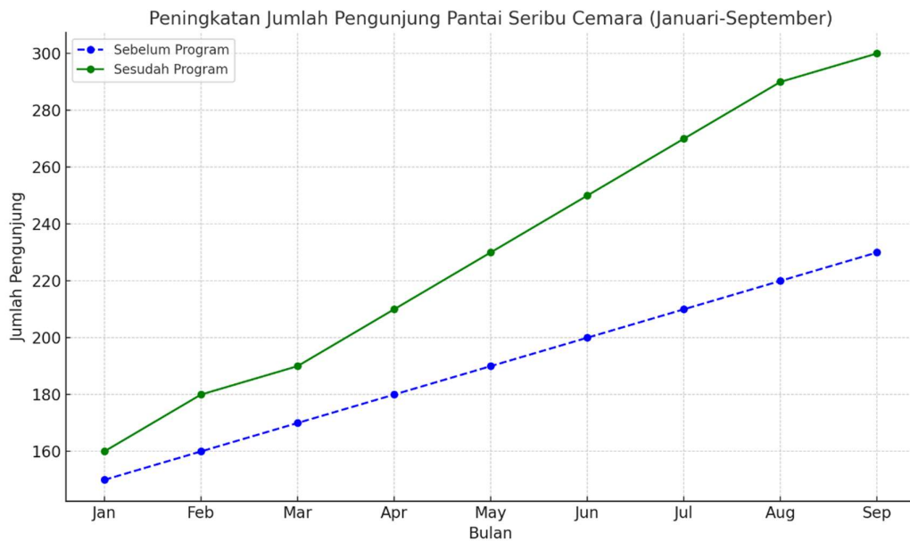
Gambar 5. Grafik Peningkatan Jumlah Pengunjung 1 th terakhir

Data pada Gambar 5 menunjukkan perbedaan yang signifikan antara sebelum dan sesudah dilaksanakannya kegiatan perbaikan dan promosi destinasi Pantai Seribu Cemara dari bulan Januari hingga September. Grafik ini menggambarkan pertumbuhan yang bertahap dan lebih natural dalam jumlah pengunjung selama periode tersebut. Pada awal program, peningkatan jumlah pengunjung masih bertahap karena program baru mulai diterapkan dan efek promosi belum sepenuhnya dirasakan. Setelah infrastruktur dan fasilitas mulai diperbaiki serta promosi yang lebih intensif dilakukan, peningkatan pengunjung mulai terasa lebih signifikan. Meskipun tidak terlalu drastis, ada pertumbuhan yang konsisten. Peningkatan lebih stabil seiring dengan bertambahnya promosi dan semakin meningkatnya kesadaran masyarakat terhadap destinasi wisata ini. Musim liburan juga berkontribusi pada kenaikan pengunjung di bulan Agustus sampai dengan September.