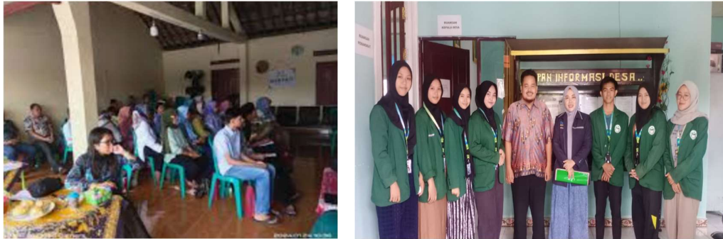
Gambar 3. Pendampingan Pengelolaan Destinasi Wisata

pemasaran digital. Pelatihan ini bertujuan untuk meningkatkan kemampuan masyarakat dalam mengelola pantai dan menarik lebih banyak pengunjung.