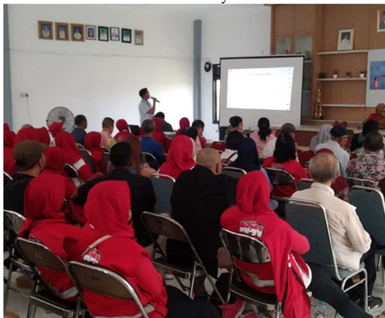
Gambar 3. Sosialisasi

Dari hasil dua tabel tersebut menunjukkan masih adanya permasalahan tentang Perempuan dan Anak yang dimiliki Kelurahan Manyar Sabrangan, meskipun dalam indikator KRPPA Kelurahan Manyar Sabrangan sudah lolos verifikasi dan memenuhi syarat.