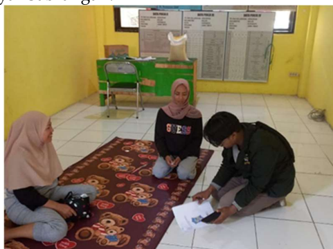
Gambar 2. Pengumpulan Data

Pengumpulan data pada tahap ini menggunakan 3 metode yaitu meneliti lapangan, bercerita, dan juga wawancara secara langsung. Sasarannya untuk pengumpulan data ini adalah Kesra Kelurahan Manyar Sabrangan, Ketua RW, dan juga Ketua RT. Dalam proses pengumpulan data kali ini pendamping berkolaborasi bersama Kader Surabaya Hebat (KSH). Ketika sudah mendapatkan data pendamping bersama komunitas Kader Surabaya Hebat (KSH) menganalisis hasil datanya apakah ditemukan perbedaan indikator KRPPA antar RW atau bahkan data yang dimiliki Kelurahan Manyar Sabrangan.