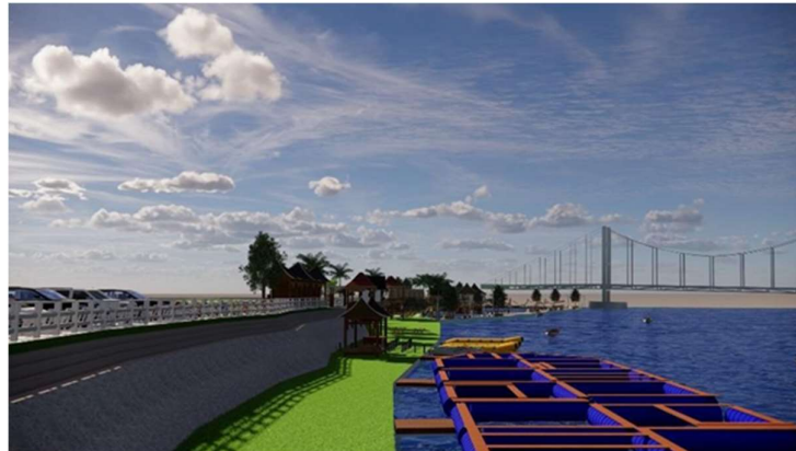
Gambar 8. Areal View Kawasan