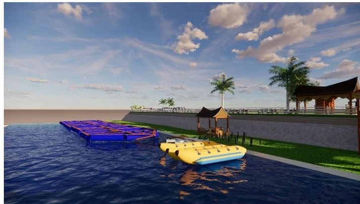
Gambar 4. Suasana Zona Konservasi