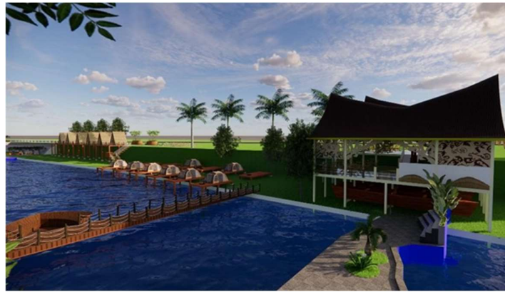
Gambar 5. Suasana Zona Komersial