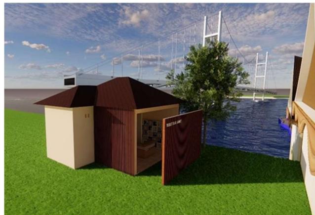
Gambar 6. Suasana Zona Servis

Pendekatan rancangan yang diterapkan adalah Wisata Alam dan Budaya. Pendekatan ini mengedepankan adanya pertimbangan hubungan antara pemenuhan kebutuhan aktivitas manusia dengan memperhatikan dan menjaga kondisi keasrian lingkungan dengan mempertimbangkan aspek budaya yang berlaku di masyarakat.