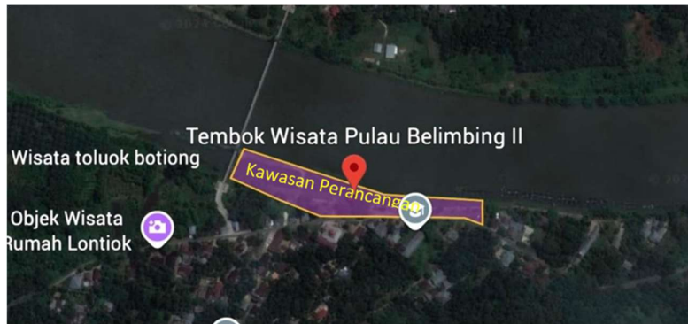
Gambar 1. Lokasi Perancangan

Lokasi Pengabdian adalah kawasan tepian air di Dusun Pulau Belimbing II, Desa Kuok, Kecamatan Kuok, Kabupaten Kampar. Posisi Dusun Pulau Belimbing lebih kurang 10 menit dari Kantor Desa Kuok, 14 menit dari Kantor Camat Kuok. Jika di ukur ke Pusat Kota Bangkinang lebih kurang 17 menit. Dusun Pulau Belimbing II dilewati oleh Sungai Kampar dan disalah satu penggal sungai disekitar jembatan terbentuk delta pasir secara alami. Saat ini penduduk dusun Pulau Belimbing II mayoritas bekerja sebagai pedagang. Saat ini tidak terdapat upaya pemaksimalan potensi wisata desa yang seharusnya dapat meningkatkan kesejahteraan masyarakat.