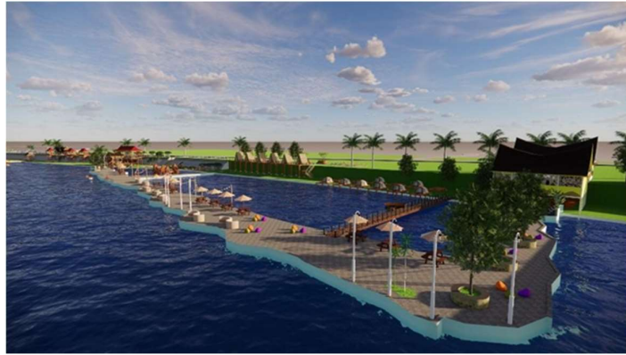
Gambar 3. Suasana Zona Rekreasi