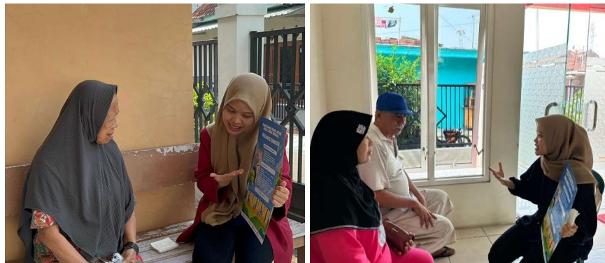
Gambar 3. Edukasi Pencegahan Risiko Jatuh