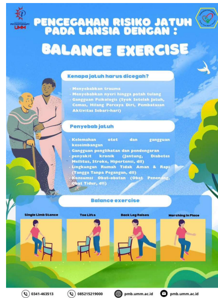
Gambar 4. Poster Pencegahan Risiko Jatuh