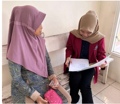
Gambar 2. Pre-Test dan Post-Test

Edukasi pencegahan risiko jatuh pada lansia sangat dibutuhkan oleh lansia karena jatuh menjadi penyebab utama kematian dan menyebabkan cedera serius seperti patah tulang maupun cedera otak traumatis. Oleh karena itu, edukasi pencegahan risiko jatuh sangat diperlukan oleh lansia maupun pihak keluarga karena keluarga memegang tanggung jawab besar terhadap keselamatan lansia (Widagdo, 2024).