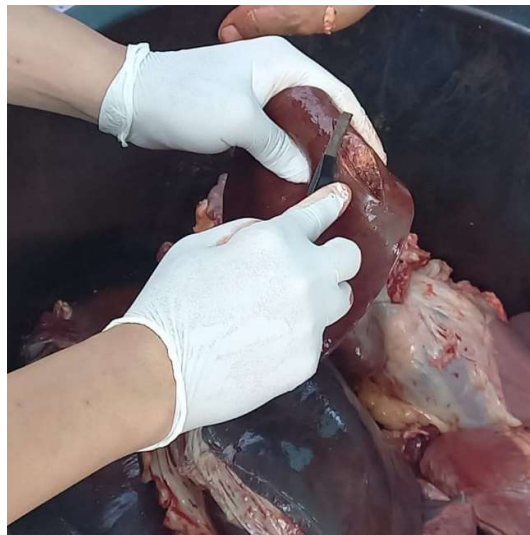
Gambar 3. Pemeriksaan Posmortem pada Organ Dalam Hewan Kurban

Infestasi caplak Boophilus microplus ditemukan pada sebagian kecil sapi. Ektoparasit adalah salah satu kendala dalam pemeliharaan ternak (Rusal dan Lestari, 2021) yang seringkali sulit untuk diatasi, terutama pada peternakan skala rakyat. Hewan dengan tingkat infestasi tinggi menunjukkan penurunan berat badan rata-rata yang signifikan dibandingkan dengan hewan dengan tingkat infestasi sedang atau rendah (Arriola et al., 2021). Lesi papilloma juga ditemukan pada beberapa ekor sapi dengan lokasi lesi di sekitar telinga. Bovine papillomatosis merupakan suatu kondisi infeksi yang ditandai dengan terbentuknya beberapa massa jinak, yang dapat mengalami regresi spontan atau berkembang menjadi neoplasia ganas, yang diakibatkan oleh infeksi virus papiloma sapi (Odhah et al., 2021).