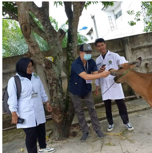
Gambar 2. Pemeriksaan Antemortem pada Hewan Kurban (sapi)

Berdasarkan informasi dari masyarakat, dalam hal ini panitia penyelenggaran qurban, sapi merupakan spesies hewan yang paling umum disembelih dari tahun ke tahun. Sebuah survei di daerah lain juga memperlihatkan bahwa sapi merupakan hewan kurban paling utama dan biasanya dikurbankan secara berkelompok, kemudian kambing dikurbankan secara individual (Ibrahim et al., 2022). Kerbau tergolong banyak dikurbankan di wilayah Kelurahan Binawidya, Kota Pekanbaru. Selama pandemi COVID-19, kambing merupakan hewan kurban yang paling banyak dipilih oleh masyarakat Jawa Timur (Saputro et al., 2021).