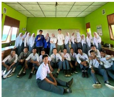
Gambar 9. Sesi Foto Bersama

Setelah pengisian kuesioner g-form maka selanjutnya dilanjutkan dengan penutupan sesi foto bersama peserta pelajar.