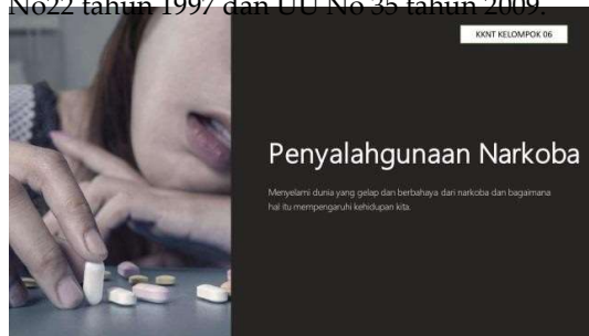
Gambar 3. Materi Penyalahgunaan Narkoba

Setelah perkenalan, kegiatan penyuluhan berlangsung kurang lebih 1 jam 30menit dalam satu kelas, setelah istirahat lanjut di kelas berikutnya berdasarkan jadwal yang telah dibuat sebelumnya. Berikut paparan materi yang sudah dirangkum dan disiapkan dalam bentuk slide melalui power point tentang pengenalan apa itu narkoba, jenis-jenis tingkatan narkoba berdasarkan golongan nya mulai darigolongan tingkat I yang merupakan golongan tingkat paling tinggi, golongan tingkat II yaitu narkoba jenis pengobatan yang dapat digunakan sebagai pilihan terakhir tetapi masih dikategorikan tinggi, dan golongan tingkat III umumnya memiliki potensi ketergantungan yang lebih rendah dibandingkan dengan golongan II, apa saja dampak yang diakibatkan apabila menyalahgunakan narkoba seperti dampak secara kesehatan maupun psikologis, faktor penyebab penyalahgunaan narkoba, Cara mengatasi penyalahgunaan narkoba yang dapat dimulai dari rehabilitasi,dan program-program pencegahan narkoba, dan tindakan hukum yang mengatur tentang narkotika berdasarkan UU No22 tahun 1997 dan UUU No 35 tahun 2009.