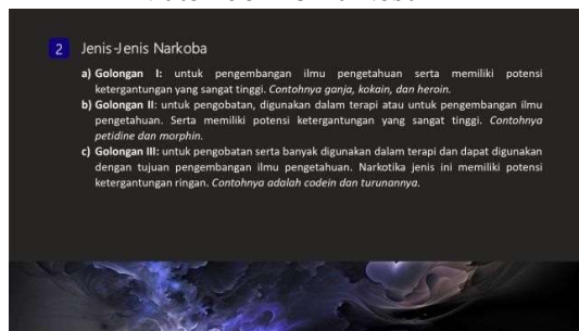
Gambar 5. Materi jenis jenis narkoba