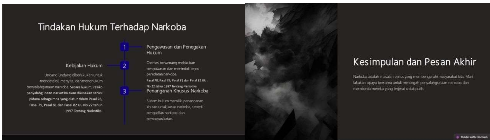
Gambar 8. Materi Tindakan Hukum Terhadap Narkoba

Kegiatan ini bersifat interaktif dengan memberikan edukasi selama proses pemaparan materi berlangsung, kemudian dilanjutkan dengan sesi tanya jawab kepada para peserta pelajar dalam mengikuti penyuluhan akan bahaya penyalahgunaan narkoba. Pada kesempatan ini pemateri mengajak para peserta pelajar berperan aktif dalam pencegahan narkoba khususnya generasi muda saat ini.