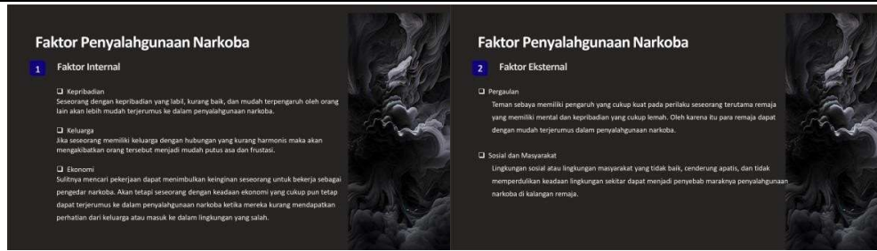
Gambar 6. Materi Dampak Negatif Penyalahgunaan Narkoba