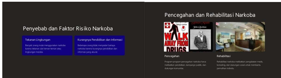
Gambar 7. Materi Penyebab dan Faktor Risiko serta Pencegahan dan Rehabilitasi Narkoba