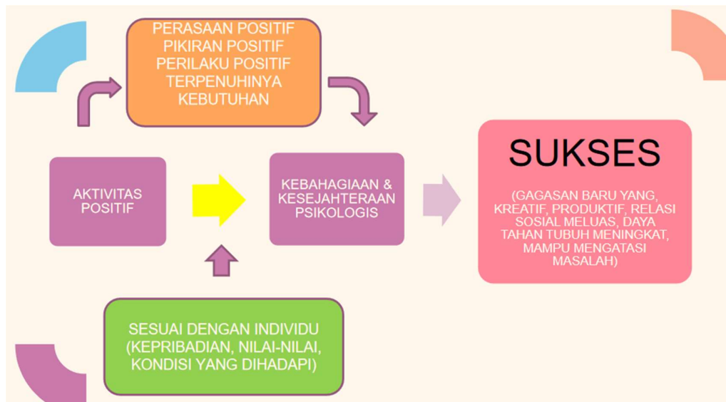
Gambar 5. Fungsi aktifitas Positif

dalam asrama atau penampungan, calon pekerja migran diharapkan tetap melakukan aktifitas fisik dengan berolah raga ringan dan kegiatan lain yang sesuai dengan kondisi masing-masing .