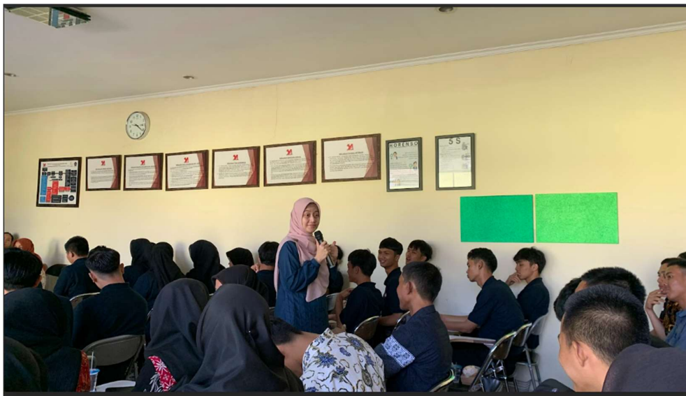
Gambar 4. Pemaparan Release Emosi

Hal berikutnya yang bisa dilakukan oleh peserta yang merupakan calon pekerja migran adalah memaafkan. Pemaafan menjadi salah satu kata kunci agar seseorang bisa meraih kebahagiaan. Memendam kemarahan, kecewa, sakit hanya akan membuat seseorang selalu berada dalam pikiran negatif. Mendendam hanya akan membuat kesehatan seseorang terganggu. Begitu banyak energi yang terkuras, untuk mereka yang hidup selalu dipenuhi rasa dendam (Aziz et al., 2017)