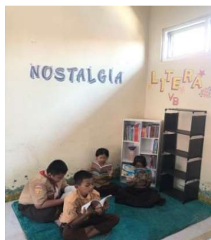
Gambar 3. Siswa sedang membaca buku saat waktu luang di Litera (Lintasan Literasi Anak)

Pada program kegiatan ini kami membuat pojok baca sederhana yang menyiapkan sudut kecil di dalam kelas sebagai area khusus untuk membaca. Pojok baca ini dilengkapi dengan rak yang berisi buku-buku yang sesuai jenjang pendidikan dan minat siswa, seperti buku pelajaran pokok, buku pelajaran pelengkap, buku bacaan fiksi dan nonfiksi, serta ensiklopedia. Program ini dapat memberikan kesempatan bagi siswa untuk meningkatkan literasi atau sebagai bagian dari kegiatan pembelajaran sehari-hari.