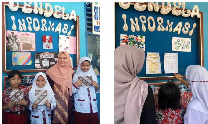
Gambar 2. Kegiatan Jendela Informasi