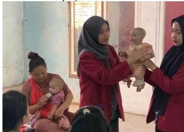
Gambar 2. Demonstrasi Cara Melakukan Baby Massage

Sebelum penyuluhan, dilakukan pre-test kepada peserta dengan tanya jawab secara langsung. Setelah itu, pembagian leaflet dilakukan agar peserta mendapatkan informasi secara ringkas dan mudah dipahami mengenai baby massage pada balita. Saat semua peserta mendapatkan leaflet, pemateri menjelaskan isi leaflet secara lebih rinci mengenai baby massage . Materi yang disampaikan berisi pengertian, manfaat, indikasi, kontraindikasi, persiapan sebelum melakukan baby massage . Kemudian, dilakukan demonstrasi cara melakukan baby massage oleh pemateri yang dipraktekkan langsung oleh peserta kepada bayi mereka. Diakhir sesi penyuluhan dilakukan diskusi dan tanya jawab.