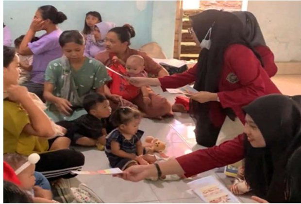
Gambar 1. Pembagian Leaflet kepada Peserta Penyuluhan

penyuluhan mengenai baby massage , membuktikan bahwa penyuluhan ini bermanfaat untuk: (1) Dapat mengedukasi dan meningkatkan pengetahuan Ibu mengenai baby massage baik berupa pengertian, manfaat, indikasi, kontraindikasi, dan persiapan sebelum melakukan pemijatan, (2) Ibu dapat mempraktekkan kembali cara melakukan baby massage kepada anaknya, (3) Membantu memfasilitasi Ibu dalam mengoptimalkan tumbuh kembang pada anak.