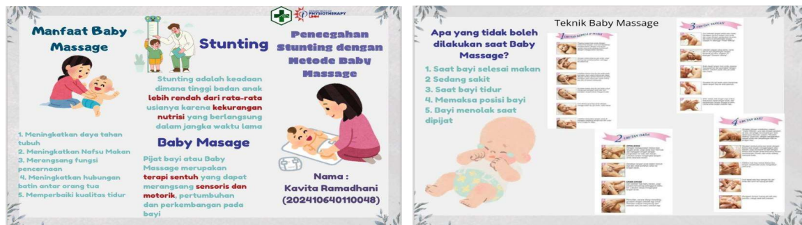
Gambar 2. Media Edukasi Leaflet