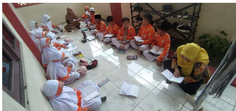
Gambar 4. Proses Membaca Buku Simak

Setelah melakukan pembelajaran dengan metode tilawati dengan materi tajwid dan pengenalan maqom-maqom irama, pendamping merefleksi pembelajaran dengan menanyakan kembali apa yang telah dipelajari. Pembelajaran dengan metode tilawati ini berpotensi menjadi metode pembelajaran Al-quran yang menyenangkan karena metode tilawati bukan saja mempelajari teori tajwid tetapi juga praktek baca dengan menggunakan irama-irama yang indah.