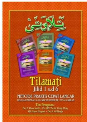
Gambar 3. Buku Simak

Metode seperti ini juga disebut dengan metode Talaqi (menirukan bacaan guru), dalam praktek baca simak ini, pendamping sesering mungkin mengulang ulang ayat yang dibaca, satu maqom lagu yang dibawakan diulang 2 kali sampai 3 kali dengan cara perlahan, kemudian seluruh santri mengikuti bacaan dengan menirukan tajwid dan irama pendamping, supaya santri memperoleh bacaan dan irama yang tepat sesuai yang diharapkan.