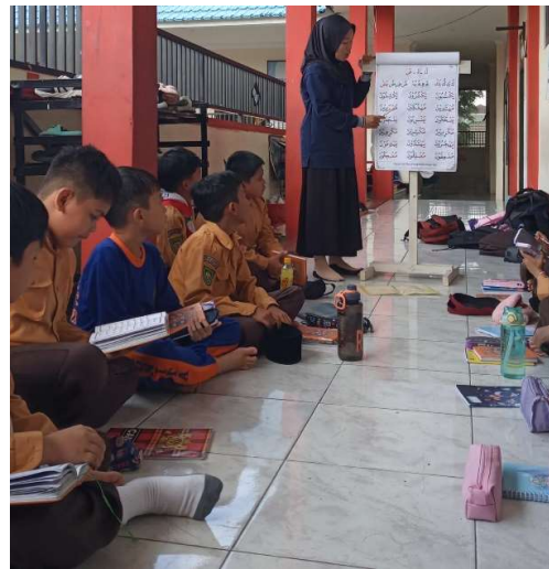
Gambar 2. Proses Membaca Alat Peraga

Setelah pendamping dan siswa membaca alat peraga, kemudian pendamping memulai kembali dengan meminta para siswa dan siswi untuk wajib membuka buku simak, terutama pada jilid 3. Pendamping memulai kegiatan praktek baca simak dengan membaca taa'uz dan basmallah sebagai adab terapan dalam membaca Al-Quran, sistem dalam baca simak sama seperti membaca alat peraga yang dimana pendamping terlebih dahulu yang kemudian dilanjutkan oleh para siswa, seperti bacaan dan irama yang dibawakan oleh pendamping.