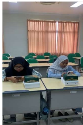
Gambar 3. Pretest dan Posttest

Hasil kegiatan menunjukkan bahwa setelah dilakukan kegiatan pengabdian, terjadi peningkatan pemahaman dan pengalaman peserta mengenai strategi komunikasi yang efektif dalam membangun pertemanan dimana hasil pretest dan posttest mengalami peningkatan.