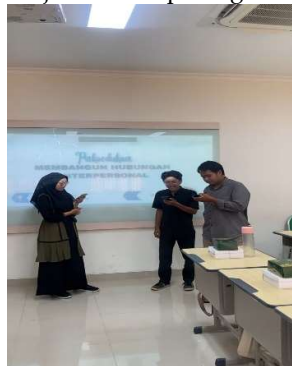
Gambar 2. Role play

Pada tahap selanjutnya yaitu dengan metode praktik atau role play. Tim pengabdian memilih tiga peserta untuk berpartisipasi dalam sebuah sesi praktik bermain peran. Dalam sesi ini, para peserta diminta untuk membawakan teks berjudul "Memberikan Kesempatan untuk Menjalin Persahabatan", melalui permainan peran ini, tim bertujuan untuk memberikan pemahaman yang lebih mendalam kepada peserta mengenai pentingnya komunikasi terbuka dalam menjaga dan memperkuat hubungan pertemanan. Teks yang dimainkan juga berisi situasi yang menekankan bagaimana membahas masalah secara langsung dan jujur dapat menjadi cara yang efektif untuk menyelesaikan konflik yang mungkin muncul dalam pertemanan. Dengan kegiatan ini, diharapkan peserta tidak hanya memahami teori komunikasi yang efektif, tetapi juga mampu menerapkannya dalam kehidupan sehari-hari, terutama dalam menciptakan dan mempertahankan hubungan sosial yang sehat. Setelah sesi role play selesai, selanjutnya yaitu dilakukan dengan pemberian posttest. Posttest digunakan untuk mengukur keberhasilan kegiatan pengabdian dan sejauh mana peningkatan mengenai pemahaman para peserta.