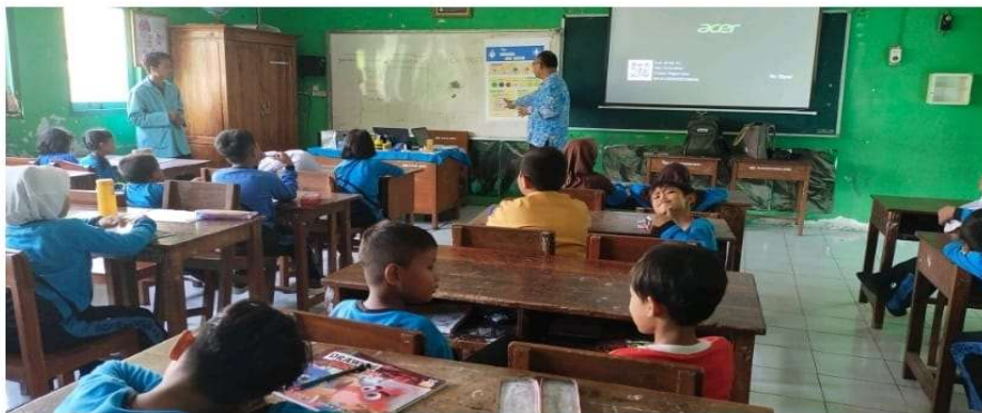
Gambar 2. Foto kegiatan siswa berdiskusi, praktek langsung penggolongan obat dan Refleksi.