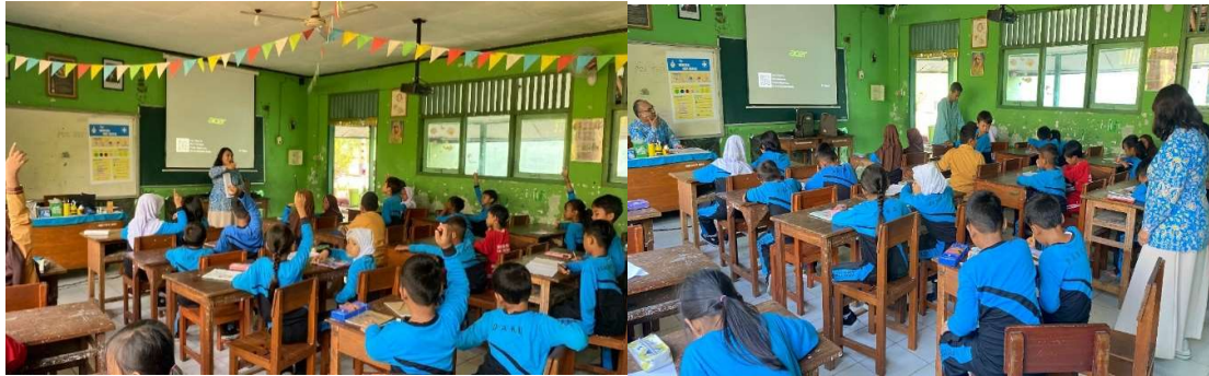
Gambar 1. Foto Kegiatan Pembelajaran CBIA