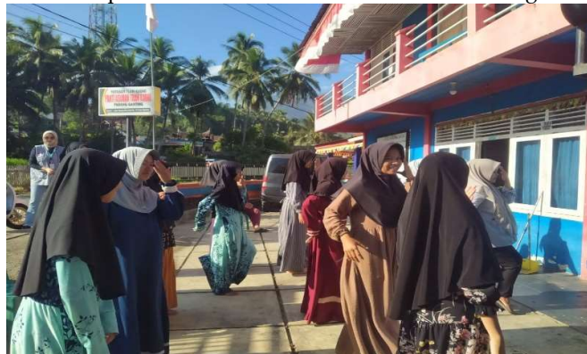
Gambar 2. Kegiatan Senam bersama anak asuh LKSA

Hal pertama yang dilakukan sebelum acara berlangsung yaitu melakukan survey lapangan, serta berdiskusi mengenai materi yang akan disampaikan apakah nantinya akan sesuai dengan usia mereka. Kemudian pada hari H kegiatan yang pertama dilakukan yaitu mengajak anak-anak untuk melaksanakan senam, yang dilanjutkan dengan makan bersama. Kemudian dilanjutkan dengan penyampaian materi oleh tim mahasiswa yang terlibat dalam kegiatan ini. Ditengah penyampaian materi tim melakukan ice breaking . Selanjutnya kegiatan dilanjutkan dengan memberikan pertanyaan berhadian kepada anak-anak asuh. Hadiah-hadiah kecil ini juga membantu membuat suasana kegiatan lebih meriah, serta memotivasi peserta didik untuk lebih aktif dalam mengikuti kegiatan ini.