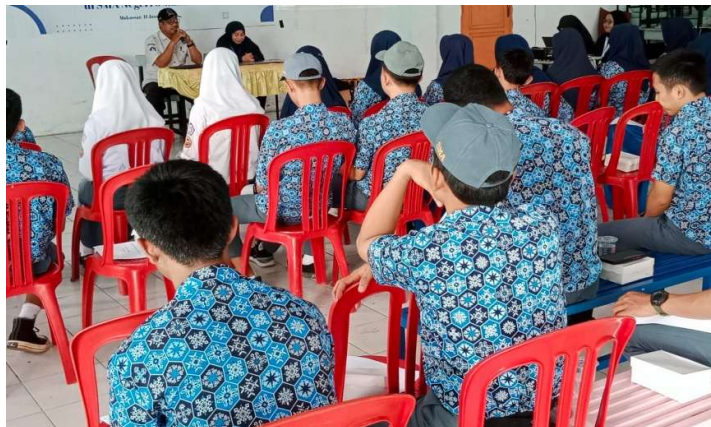
Gambar 2. Pelaksanaan Pengabdian