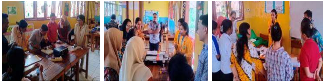
Topik Listrik dan Magnet

Materi tentang penggunaan KIT IPA disampaikan oleh mahasiswa dalam hal ini adalah asisten praktikum fisika. Setelah paparan materi dilakukan diskusi bersama dengan peserta untuk dilakukan praktik pendalaman penggunaan KIT IPA. Kemudian, diakhir kegiatan, peserta diminta mengisi kuesioner post-test kegiatan. Hasil evaluasi berdasarkan data yang ditampilkan dalam Gambar 1.2. menunjukkan bahwa terjadi peningkatan sebesar 34% terhadap pemahaman guru tentang penggunaan alat peraga KIT IPA di sekolah. Kegiatan yang dilakukan untuk pendalaman keterampilan guru terhadap KIT IPA dapat dilihat pada Gambar 1.4, berikut ini.