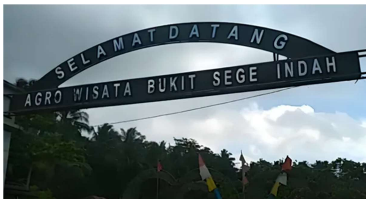
Gambar 1. Lokasi Agrowisata Bukit Sege Indah

Adanya wisata tentunya terdapat daya tarik para wisatawan untuk mengilangkan rasa penasaran terkait keinginannya untuk dapat mengunjungi wisata tersebut. Dalam hal ini Agro Wisata Bukit Sege Indah (BSI) yang menjadi daya tarik wisatawan adalah pemberdayaan kebun durian montong. Memang, di desa Adisana sangat terkenal dengan durian montongnya yang cenderung memiliki bau khas dibandingkan dengan durian pada umumnya. Oleh karena itu, pemberdayaan ini harus selalu dapat ditingkatkan oleh masyarakat dan pemerintah desa setempat untuk dapat memberikan edukasi maksimal kepada pengunjung yang mana menjadi daya tarik di wisata BSI ini. Seperti halnya, bahwa melalui kebun durian montong ini para pengunjung dapat melihat bagaimana proses penanaman, perawatan, sampai pada panen hasil yang luas lahannya sekitar 19 hektar. Konsep yang diusungkan merupakan wisata pertanian yang nantinya pengunjung dapat menikmati durian montong baik secara langsung dari pohonnya ataupun sambil bersantai ditempat yang disediakan.