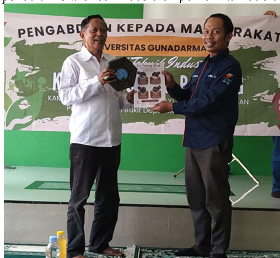
Gambar 7. Penyerahan Simbolis Eco Paving Block Kepada Pemerintah Daerah Sasakpanjang

Kegiatan PKM ini mendapat dukungan dari pemerintah desa setempat wilayah Sasak Panjang, Kabupaten Bogor melalui mitra KRS Apel Sasak Panjang, karena sejalan dengan target Sustainable Development Goals (SDGs), khususnya dalam poin 12 yaitu konsumsi dan produksi yang bertanggung jawab dan poin 13 yaitu penanganan perubahan iklim. Sehingga Eco paving block dapat menjadi model inovasi yang diadopsi dalam skala lebih luas oleh pemerintah daerah atau sektor swasta.