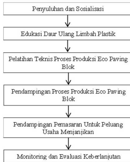
Gambar 2. Alur Kegiatan Tim Prodi Teknik Industri