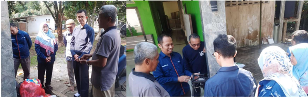
Gambar 5. Pelatihan Teknis Proses Produksi Eco Paving Blok

Mendapat informasi bahwa produk eco paving block berkualitas, ramah lingkungan, daya tahan yang baik terhadap tekanan dan cuaca, bobot yang lebih ringan dibandingkan paving block konvensional. Produk ini memenuhi standar konstruksi sehingga dapat digunakan untuk berbagai keperluan infrastruktur. Dari pendampingan masyarakat dapat meningkatkan kesadaran akan pentingnya daur ulang limbah plastik, karena program pengabdian kepada masyarakat dari prodi teknik industri Universitas Gunadarma mendorong pengelolaan limbah berbasis komunitas, di mana masyarakat secara aktif terlibat dalam pengumpulan dan pengolahan limbah plastik.