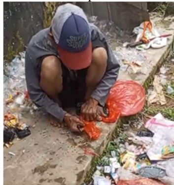
Gambar 3. Proses Pemilahan dan Pematangan Limbah Plastik

Program pendampingan produksi eco paving block berbasis limbah plastik rumah tangga bertujuan untuk mengubah limbah menjadi produk bernilai guna tinggi. Hasil yang dapat dicapai dari pelaksanaan kegiatan pendampingan adalah peningkatan keterampilan masyarakat dalam hal pemilahan limbah plastik rumah tangga yang dapat digunakan, serta pengolahan limbah plastik (Intan et al., 2019) melalui proses pencacahan, pelelehan, dan pencampuran. Pencetakan eco paving block dengan berbagai bentuk dan ukuran standar. Masyarakat juga dibekali pengetahuan tentang pengelolaan limbah secara berkelanjutan dan manfaat produk ramah lingkungan.