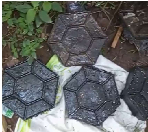
Gambar 6. Eco Paving Blok

Kegiatan PKM ini mendapat dukungan dari pemerintah desa setempat wilayah Sasak Panjang, Kabupaten Bogor melalui mitra KRS Apel Sasak Panjang, karena sejalan dengan target Sustainable Development Goals (SDGs), khususnya dalam poin 12 yaitu konsumsi dan produksi yang bertanggung jawab dan poin 13 yaitu penanganan perubahan iklim. Sehingga Eco paving block dapat menjadi model inovasi yang diadopsi dalam skala lebih luas oleh pemerintah daerah atau sektor swasta.