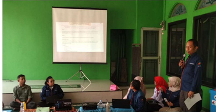
Gambar 4. Edukasi Daur Ulang Limbah Plastik

produksi eco paving block lebih murah dibandingkan paving block konvensional, sehingga memberikan keuntungan yang kompetitif.