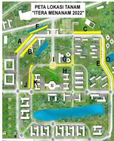
Gambar 1. Peta Penanaman Pohon Tabebuya