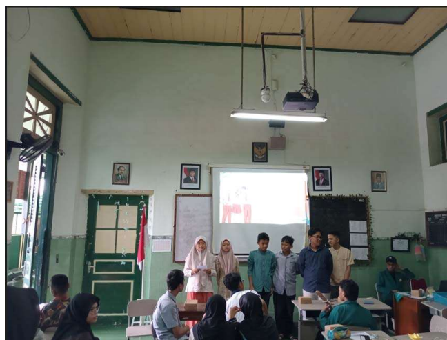
Gambar 4 Pemaparan Kasus

Data pertama dalam penelitian ini di tentukan melalui hasil pre-test dan data kedua di tentukan melalui hasil post-test. Kedua data tersebut dapat dilihat pada tabel 1.