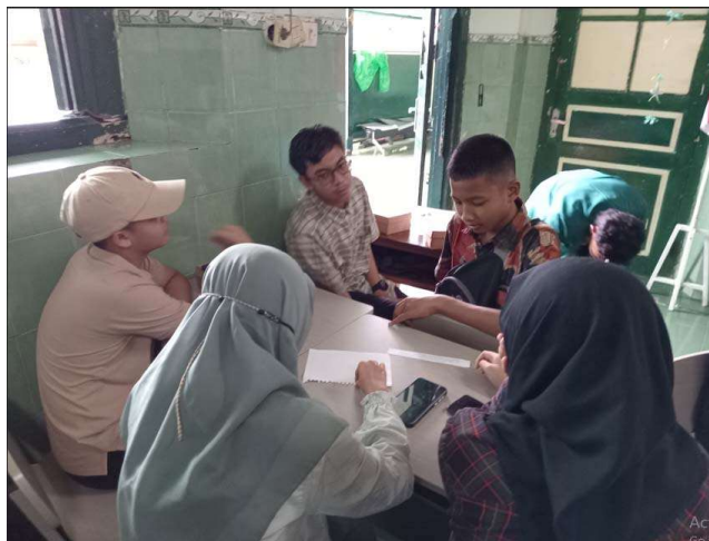
Gambar 3. Diskusi kasus