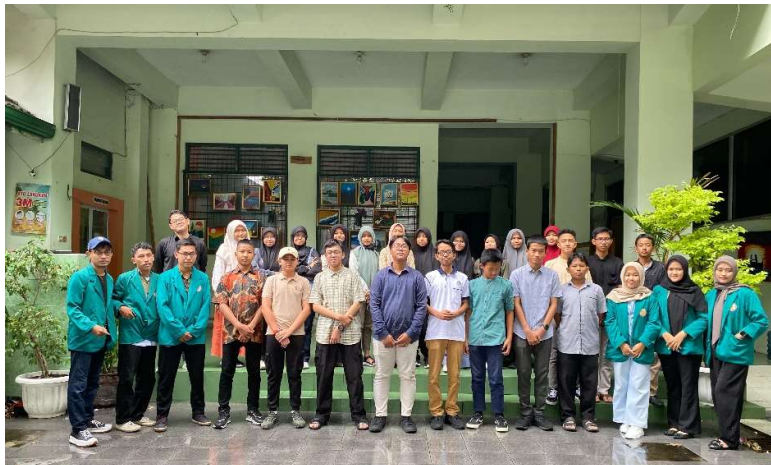
Gambar 1. Peserta Kegiatan Pelatihan

Sebelum pemaparan materi, pelaksana kegiatan melakukan pre-test melalui link google form dan setelah pemaparan materi pelaksana melakukan post-test yang bertujuan untuk melihat perbedaan sejauh mana pemahaman peserta mengenai pemecahan masalah dan pengambilan keputusan.