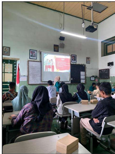
Gambar 2. Proses psikoedukasi

Sebelum pemaparan materi, pelaksana kegiatan melakukan pre-test melalui link google form dan setelah pemaparan materi pelaksana melakukan post-test yang bertujuan untuk melihat perbedaan sejauh mana pemahaman peserta mengenai pemecahan masalah dan pengambilan keputusan.