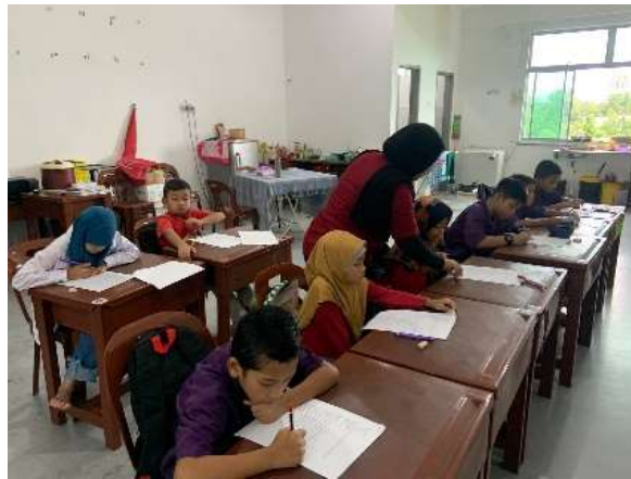
Gambar 2. Pelaksanaan Pre-Test