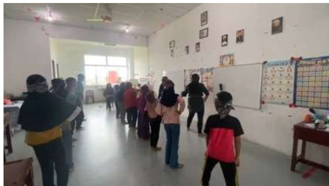
Gambar 3. Pelaksanaan Siklus

Pada pertemuan pertama, siswa diperkenalkan kepada Tari Dongklak, yang merupakan bagian dari warisan budaya Indonesia. Instruktur menjelaskan sejarah dan makna dari tari tersebut, serta nilai-nilai budaya yang ada di dalamnya. Siswa diajak untuk mendengarkan musik pengiring tari, serta melihat video atau demonstrasi tari. Tujuan dari pertemuan ini adalah untuk membangkitkan minat siswa dan memberikan pemahaman dasar tentang Tari Dongklak.