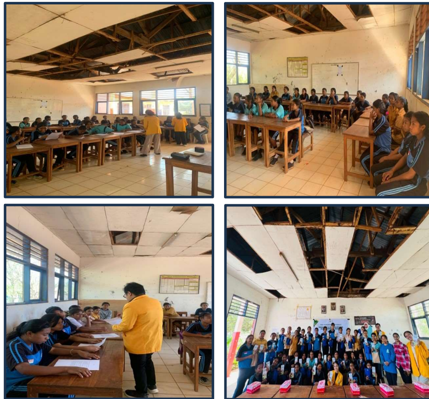
Gambar 1. Pelaksanaan kegiatan Sosialisasi dan Hygiene Alat Reproduksi Wanita SEHAT (Genital Personal Hygiene)