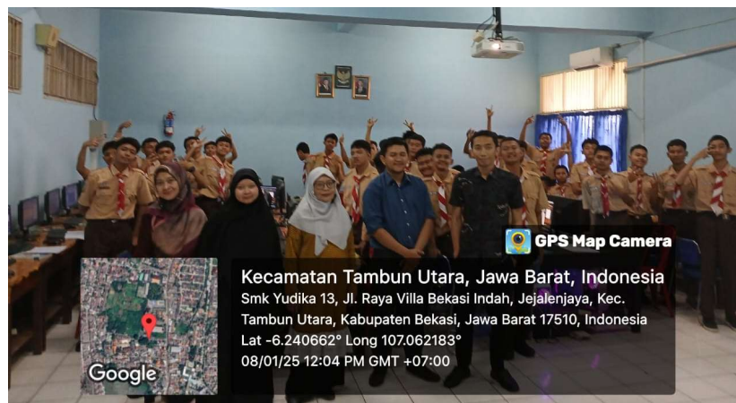
Gambar 4. Antusias Siswa Saat Pelatihan

Pada saat pendampingan praktek untuk siswa, tim abdimas berkeliling melakukan pendampingan dengan maksud agar setiap siswa yang kesulitan dapat terbantu dengan cepat dan semua bisa mengikuti arahan dengan baik. Kegiatan pendampingan terlihat pada gambar 3.