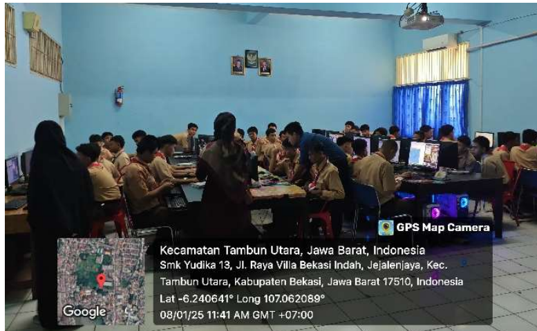
Gambar 3. Pendampingan Pelaksanaan Pelatihan

Pada saat pendampingan praktek untuk siswa, tim abdimas berkeliling melakukan pendampingan dengan maksud agar setiap siswa yang kesulitan dapat terbantu dengan cepat dan semua bisa mengikuti arahan dengan baik. Kegiatan pendampingan terlihat pada gambar 3.