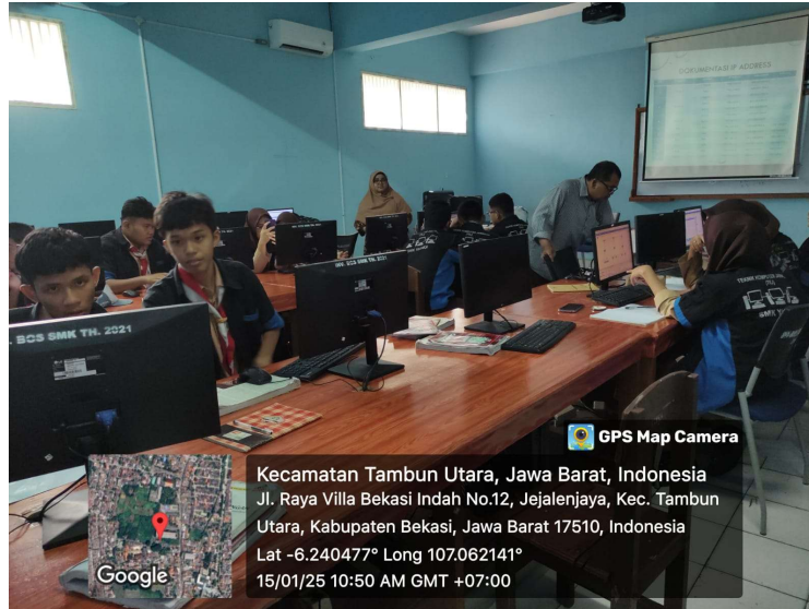
Gambar 5. Peserta Diskusi dan Pemecahan Studi Kasus

Diskusi kelompok dan pemecahan studi kasus yang dilakukan menunjukkan peningkatan keterampilan komunikasi dan kerja sama di antara peserta. Umpan balik dari peserta juga menunjukkan bahwa metode pembelajaran interaktif dan praktik langsung yang digunakan dalam kegiatan ini sangat membantu mereka dalam memahami materi.