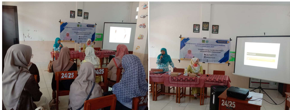
Gambar 3. Pemaparan Sesi Seminar dan Diskusi