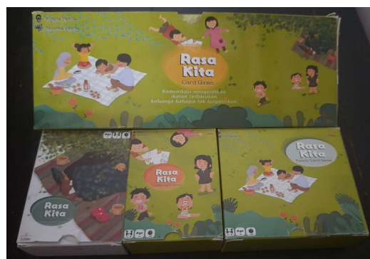
Gambar 4. Kartu Permainan "Rasa Kita"

Kartu permainan "Rasa Kita" diperkenalkan sebagai alat bantu untuk meningkatkan interaksi positif antara orang tua dan anak. Peserta memberikan tanggapan positif terhadap penggunaannya,