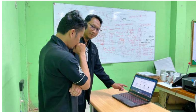
Gambar 2. Penyampaian Rancangan Desain

Para pegawai dan pimpinan inti poto Medan mengikuti seluruh kegiatan pengabdian. Berikut ini beberapa dokumentasi kegiatan dalam pengabdian masyarakat di inti poto Medan :