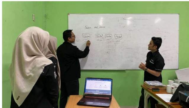
Gambar 3. Kegiatan Penyampaian Kebutuhan Website