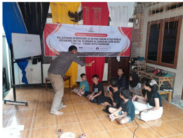
Gambar 3. Penyampaian pemahaman dasar mengenai hal sebelum penampilan

Setelah menentukan tema, tim Abdimas menyusun modul pelatihan yang disesuaikan dengan kebutuhan komunitas. Modul ini mencakup berbagai topik seperti dasar-dasar public speaking, teknik mengatasi rasa gugup, penyusunan struktur pidato yang baik, hingga cara menggunakan bahasa tubuh secara efektif. Selain itu, tim juga berkoordinasi dengan pengurus Sanggar Seni Reak Tibelat untuk menentukan jadwal pelatihan dan lokasi kegiatan. Hal ini dilakukan untuk memastikan seluruh anggota sanggar dapat mengikuti pelatihan dengan maksimal tanpa mengganggu jadwal kegiatan seni mereka. Pelaksanaan Kegiatan Pelatihan Kegiatan pelatihan public speaking dilaksanakan di Sanggar Seni Reak Tibelat dengan suasana yang penuh semangat dan antusiasme. Pelatihan ini dibuka secara resmi oleh dosen dari Telkom University, yang memberikan sambutan hangat serta motivasi kepada peserta. Dalam sambutannya, beliau menekankan pentingnya public speaking sebagai salah satu keterampilan yang dapat membantu para seniman dalam mengembangkan karier mereka, baik di tingkat lokal maupun nasional. Pelatihan berlangsung dalam beberapa sesi yang melibatkan teori dan praktik. Pada sesi pertama, peserta diberikan pemahaman dasar mengenai public speaking, termasuk pentingnya mempersiapkan materi sebelum tampil di depan umum (Nurcandrani et al., 2020)