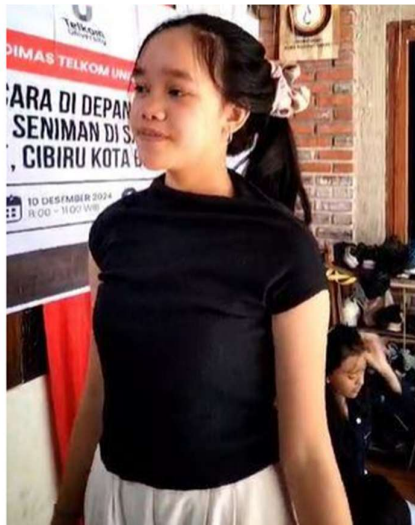
Gambar 4. sesi diskusi dan tanya jawab

pada latihan praktis. Peserta diminta untuk membuat dan menyampaikan pidato singkat di depan kelompok. Selama sesi ini, para peserta mendapat masukan dari fasilitator terkait kelebihan dan hal-hal yang perlu diperbaiki. Interaksi ini membantu peserta untuk memahami kekuatan dan kelemahan mereka dalam berbicara di depan umum. Pelatihan ditutup dengan sesi diskusi dan tanya jawab. Dalam sesi ini, peserta diberikan kesempatan untuk berbagi pengalaman dan tantangan yang mereka hadapi selama pelatihan. Banyak peserta mengaku awalnya merasa gugup, tetapi berkat pelatihan ini, mereka mulai merasa lebih percaya diri dalam berbicara di depan publik (Seva & Siga, 2022). Acara kemudian ditutup secara resmi dengan penyampaian terima kasih oleh perwakilan dari Sanggar Seni Reak Tibelat kepada tim Abdimas