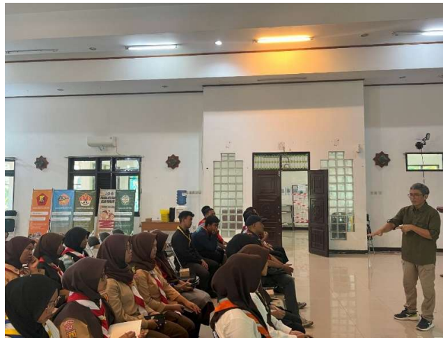
Gambar 2. Pemateri Digital Security

Selanjutnya peserta juga diberikan pemahaman terkait sasaran penipuan di media digital yaitu, Game Online, Link Streaming Ilegal, Media Sosial, Dating App, dan Grup Pekerjaan sampingan. Semua bentuk celah penipuan itu bermetamorfose dalam banyak bentuk diantaranya peretasan akun, impersonasi, Penjual Palsu, lowongan kerja palsu, dan Modus Percintaan (Syafuddin et al., 2023)