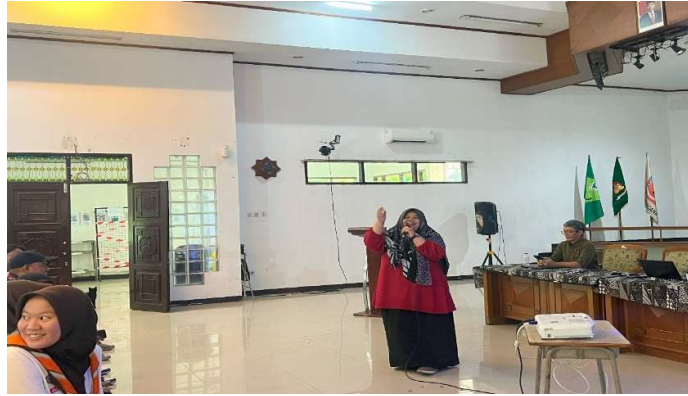
Gambar 4. Pemateri CatFishing

Untuk selanjutnya, beberapa langkah yang bisa dilakukan untuk menghindari catfishing diantaranya mengupayakan untuk mengecek informasi tentang seseorang yang menjadi teman, mengecek followers teman. Saat menjalin hubungan didunia maya, sebisa mungkin untuk menghindari memberikan data pribadi, tidak mudah percaya dengan teman baru dan untuk tidak terbawa perasaan saat menjalin hubungan di dunia maya (Pramudiarja et al., 2023)