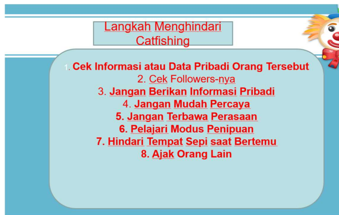
Gambar 5. Tampilan visual materi CatFishing

Untuk selanjutnya, beberapa langkah yang bisa dilakukan untuk menghindari catfishing diantaranya mengupayakan untuk mengecek informasi tentang seseorang yang menjadi teman, mengecek followers teman. Saat menjalin hubungan didunia maya, sebisa mungkin untuk menghindari memberikan data pribadi, tidak mudah percaya dengan teman baru dan untuk tidak terbawa perasaan saat menjalin hubungan di dunia maya (Pramudiarja et al., 2023)