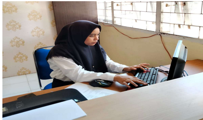
Gambar 5. Rekapitulasi Usulan Nama Bundo kanduang