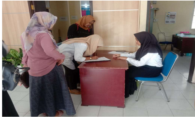
Gambar 7. Pelayanan Acara Persiapan Jambore PKK

Selama melaksanakan PkM kita melakukan pengamatan dan wawancara diakhir kegiatan dengan pihak Camat Sungai Pagu, bahwa didalam pemberian pelayanan publik terhadap masyarakat akhir-akhir ini kurang maksimal di Kantor Camat Sungai Pagu, karena disebabkan beberapa bulan terakhir terjadi pengurangan tenaga kerja kontrak dan honorer, sehingga sekarang masih dalam tahap penyesuaian dengan sistem kerja yang baru dengan keterbatasan tenaga pembantu di Kantor Camat Sungai Pagu. Namun dengan adanya prgram PkM cukup terbantu dalam pemberian pelayanan publik. Melihat kondisi saat ini, Camat Sungai Pagu akan berusaha memaksimalkan ASN dan Tenaga Kerja Kontrak yang ada saat ini untuk mengoptimalkan pelayanan Publik terhadap masyarakat sungai pagu.