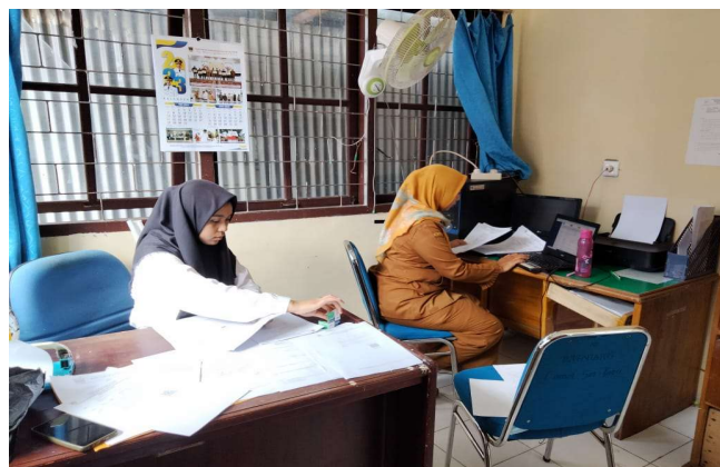
Gambar 6. Menyusun Bahan TPP ASN