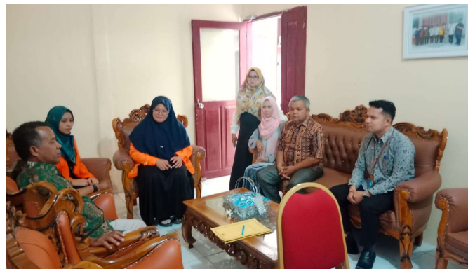
Gambar 8. Diakhir Pelaksanaan PkM

Selama melaksanakan PkM kita melakukan pengamatan dan wawancara diakhir kegiatan dengan pihak Camat Sungai Pagu, bahwa didalam pemberian pelayanan publik terhadap masyarakat akhir-akhir ini kurang maksimal di Kantor Camat Sungai Pagu, karena disebabkan beberapa bulan terakhir terjadi pengurangan tenaga kerja kontrak dan honorer, sehingga sekarang masih dalam tahap penyesuaian dengan sistem kerja yang baru dengan keterbatasan tenaga pembantu di Kantor Camat Sungai Pagu. Namun dengan adanya prgram PkM cukup terbantu dalam pemberian pelayanan publik. Melihat kondisi saat ini, Camat Sungai Pagu akan berusaha memaksimalkan ASN dan Tenaga Kerja Kontrak yang ada saat ini untuk mengoptimalkan pelayanan Publik terhadap masyarakat sungai pagu.