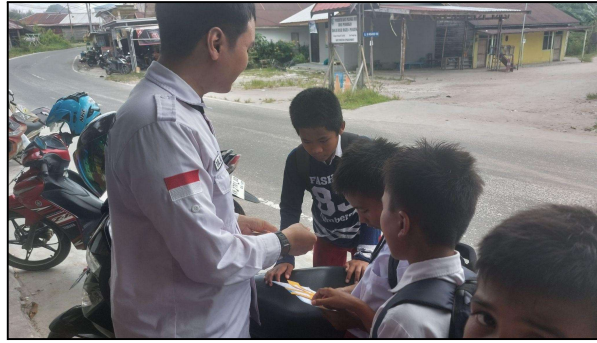
Gambar 6. Dokumentasi Kegiatan

Alat peraga ini mempermudah siswa untuk menghafal hasil perkalian dan membantu mereka memahami konsep dasar perkalian dengan lebih visual dan interaktif.