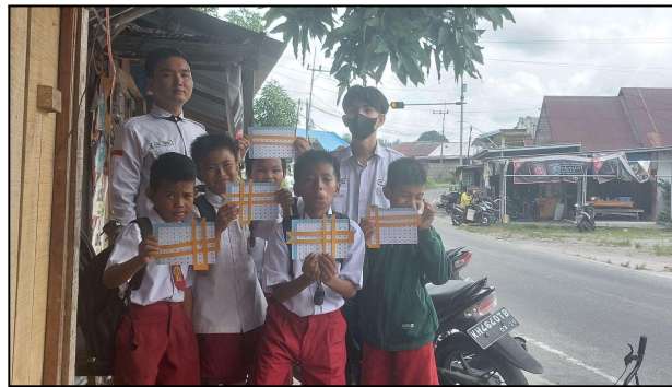
Gambar 7. Dokumentasi Kegiatan

Alat peraga ini mempermudah siswa untuk menghafal hasil perkalian dan membantu mereka memahami konsep dasar perkalian dengan lebih visual dan interaktif.