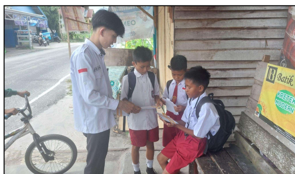
Gambar 5. Dokumentasi Kegiatan

Pada kegiatan awal, penulis mengajarkan siswa kelas 5 SDN 4 Panarung mengenai konsep perkalian menggunakan alat peraga Tabel Perkalian.