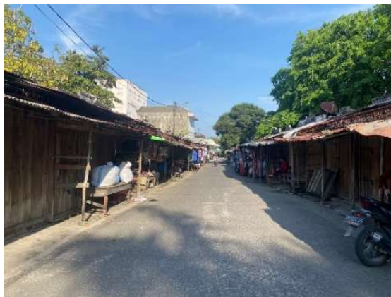
Gambar 6. Kondisi Penjual Rencana Relokasi

Perluasan Pasar Muntok ini dilakukan untuk memindahkan pedagang/penjual yang berjualan di luar kios/los dan mengganggu jalan sebagai aksesibilitas pembeli. Berdasarkan kondisi eksisting, diketahui bahwa terdapat sekurang-kurangnya 55 (lima puluh lima) pedagang yang saat ini berjualan di sepanjang Jalan Yos Sudarso. Berikut merupakan kondisi jaringan jalan yang terdampak oleh pedagang/penjual di Pasar Muntok