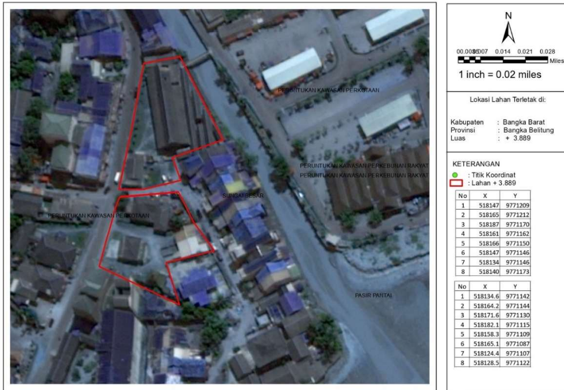
Gambar 4. Lokasi Rencana Pasar Muntok

Lokasi perencanaan Pasar Muntok berada di atas lahan dengan luas 3.889 m 2 . Berikut merupakan peta lokasi rencana Pasar Muntok.