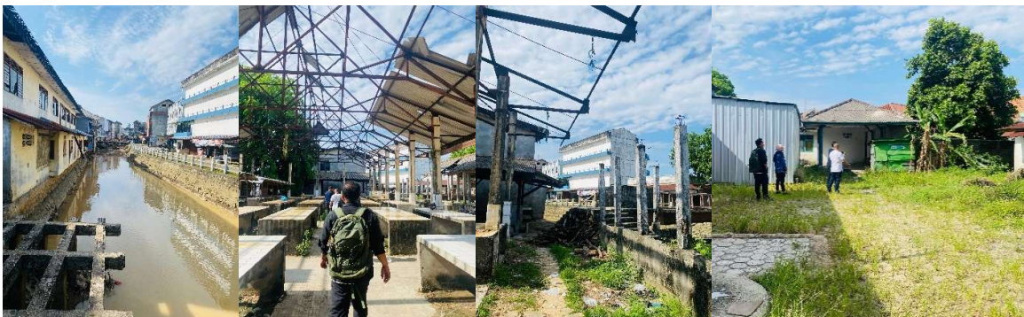
Gambar 5. Lokasi Rencana Pembebasan Lahan dan Perluasan Pasar Muntok

Berdasarkan rencana lokasi tapak di atas, diketahui bahwa lokasi tersebut berada di bagian barat lokasi Pasar Muntok eksisting. Lokasi ini terpisahkan oleh sungai yang berada diantara keduanya. Saat ini lokasi rencana pembebasan lokasi dan perluasan Pasar Muntok berupa bangunan kosong dan beberapa dipergunakan sebagai hunian atau tempat tinggal.