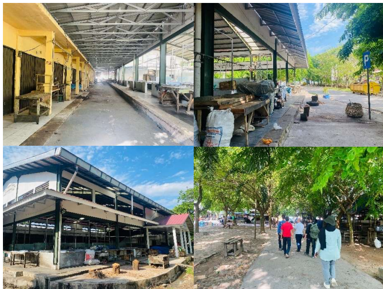
Gambar 3 Kondisi Eksisting Pasar Muntok