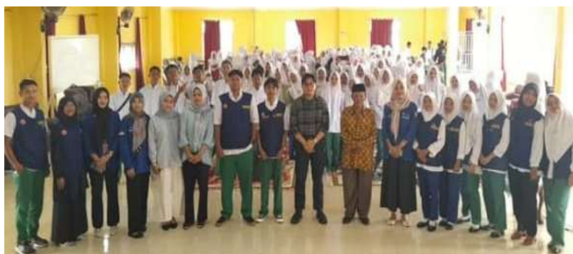
Gambar 3. Foto Bersama dengan seluruh warga kampus STIKes Piala Sakti Pariaman

Penyampaian materi tentang kekerasan seksual, pencegahan dan penanganannya diberikan di depan seluruh warga kampus STIKes Piala Sakti Pariaman selama kurang lebih 45 menit. Kegiatan dilanjutkan dengan diskusi dan tanya jawab antara pemateri dengan audiens baik mahasiswa maupun civitas akademika STIKes Piala Sakti Pariaman. Kegiatan sosialisasi diakhiri dengan berfoto bersama antara tim SatGas dan seluruh warga kampus STIKes Piala Sakti Pariaman seperti terlihat pada Gambar 3 dan 4.