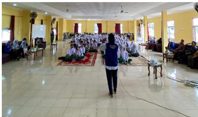
Gambar 2. Penyampaian materi

Kegiatan Pengabdian kepada Masyarakat (PkM) berupa sosialisasi pencegahan dan kekerasan seksual di lingkungan STIKes Piala Sakti Pariaman yang telah dilakukan pada hari Selasa tanggal 03 Desember 2024 berjalan dengan lancar sesuai yang diharapkan. Sosialisasi dilakukan tepat pada pukul 08.30 WIB pagi sampai selesai. Kegiatan ini diikuti oleh seluruh warga STIKes Piala Sakti Pariaman dengan penuh perhatian. Berikut beberapa foto dokumentasi yang berhasil diabadikan oleh tim Pengabdian kepada Masyarakat adalah sebagai berikut.