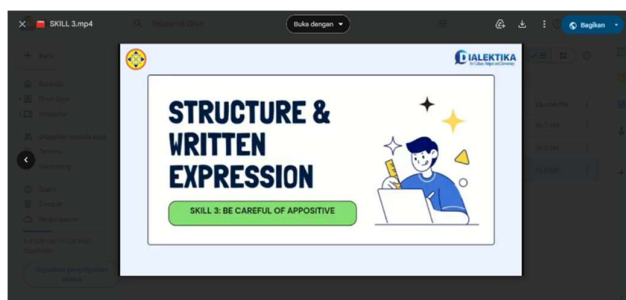
Gambar 4. Desain Video Pertama