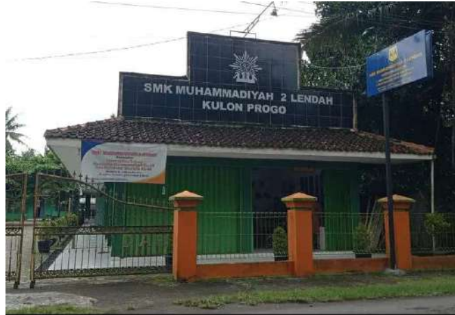
Gambar 2. Sekolah SMK Muhamamdiyah 2 Lendah

berubah-ubah tentu menjadi tantangan tersendiri bagi wirausaha, sehingga segala inovasi, cara, dan pengembangan kreatifitas baik dari segi tradisional maupun modern. Pengembangan kewirausahaan tentu harus didukung dengan kemampuan sumber daya manusia yang unggul dan mampu bersaing di era global. Sumber daya manusia (SDM) dan pengembangan usaha atau dalam arti menciptakan produk akan mempengaruhi kualitas sumber daya manusia itu sendiri. Di sini usaha atau wirausaha harus mampu melaksanakan fungsi berwirausaha secara efisien, efektif, produktif, amanah. Berwirausaha dengan mengajoi secara jujur, utamanya dalam komposisi atau kualitas SDM sesuai bidang seperti: Komposisi SDM menurut keahlian, komposisi SDM menurut pendidikan, prestasi SDM, kualitas SDM, efektifitas dan produktifitas kerja per individu. (Veithzal, 2015: 45).