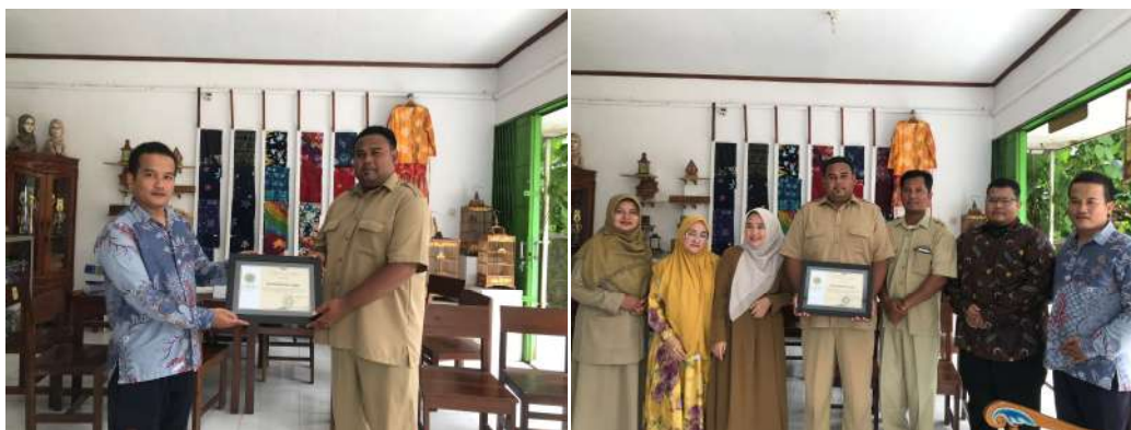
Gambar 7. Memberi Cindera Mata

Setelah semua dilakukan proses edukasi, dan praktek pembuatan dekorasi hantaran tingkat keberhasilan terbukti dengan hasil karya berupa dekorasi hantaran dari siswa SMK Muhammadiyah 2 Lendah. Di akhir acara pegabdian sebagai bentuk rasa terima kasih dan juga kerjasama antara Prodi Kewirausahaan Universitas Madani dan SMK Muhammadiyah 2 Lendah memberi cinderamata berupa plakat dari Universitas Madani secara langsung oleh Guru SMK Muhammadiyah 2 Lendah.